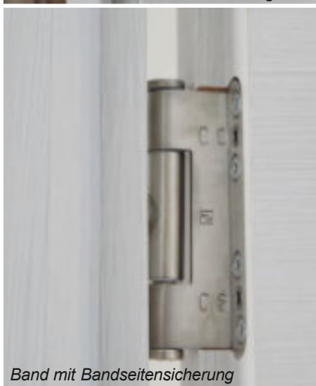
Band mit Bandseitensicherung